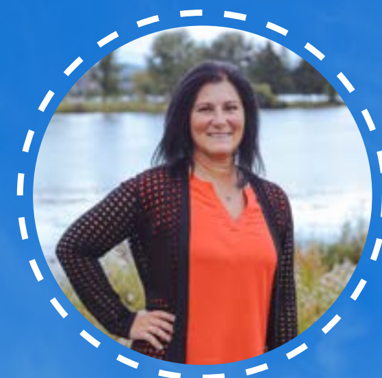
FRANCE PARTHENAIS Trésorière